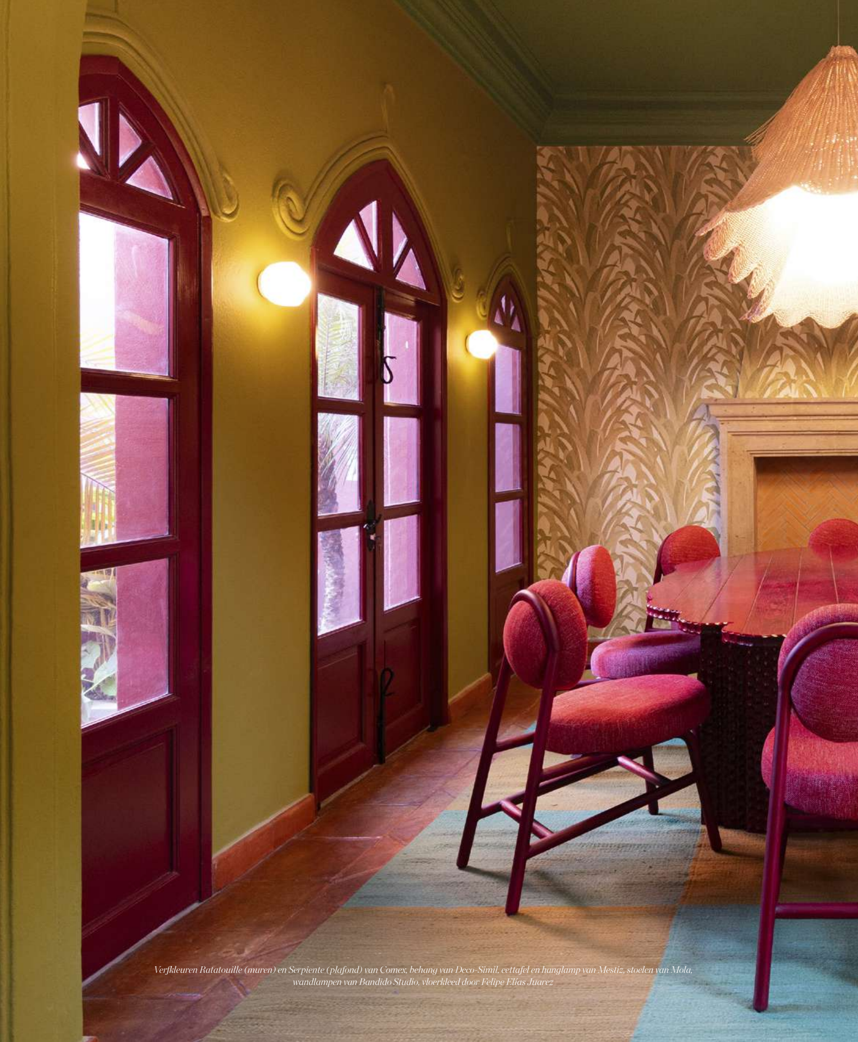
Verfkleuren Ratatouille (muren) en Serpiente (plafond) van Comex, behang van Deco-Simil, eettafel en hanglamp van Mestiz, stoelen van Mola, wandlampen van Bandido Studio, vloerleed door Felipe Elias Juarez