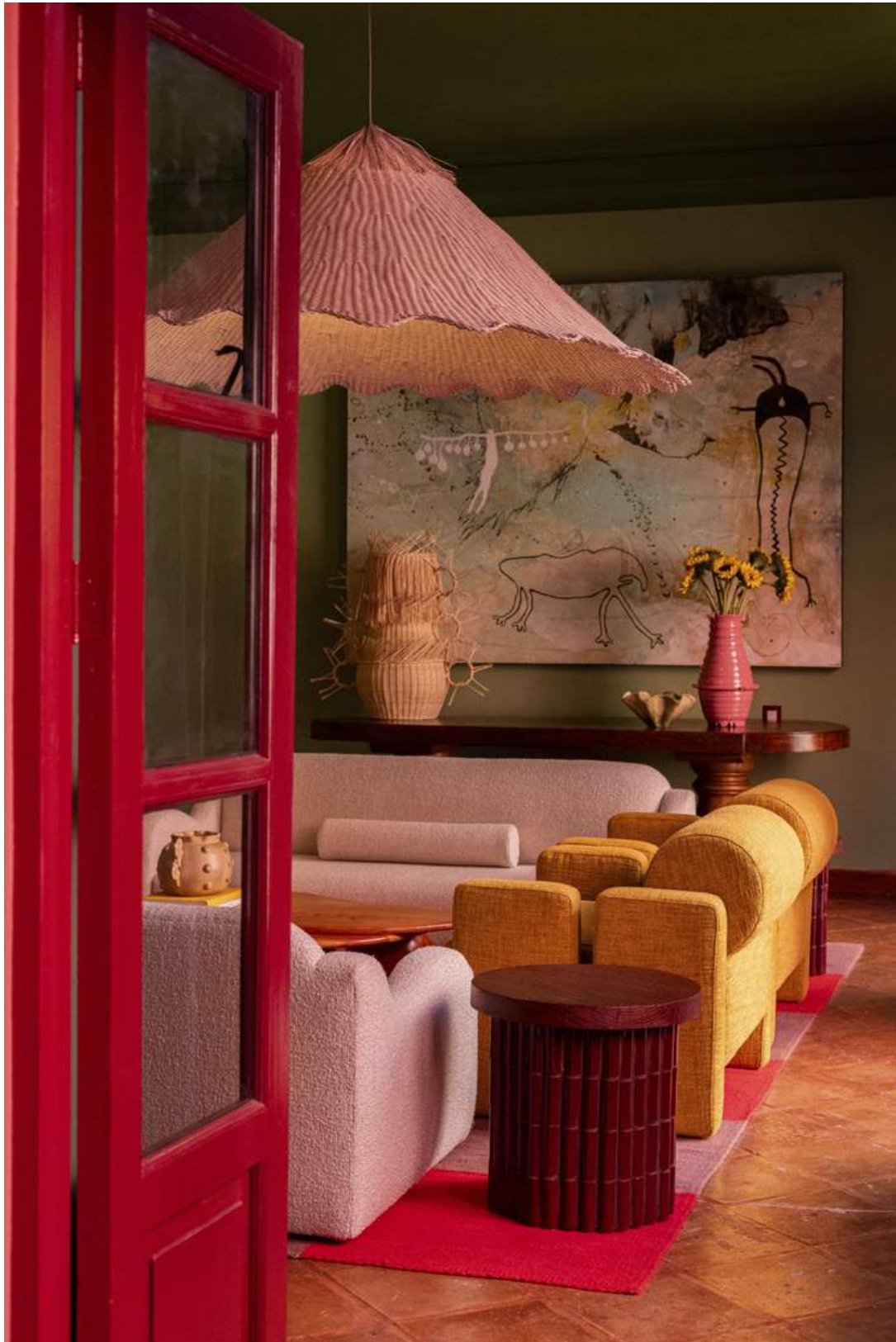
Banken en salontafel van Azotea, fauteuils van Manush, bijzettafel en sidetable van Maye, kunstwerk door Manolo Cocho, vloerkleed door Felipe Elías Juárez, hanglamp en vazen van Mestiz Rechterpagina De slanggroene, handgemaakte badkamertegels zijn van het Mexicaanse Arte Único. Het wastafelmeubel is ontworpen door Maye. Wandlamp van Bandido Studio, vaas van Mestiz