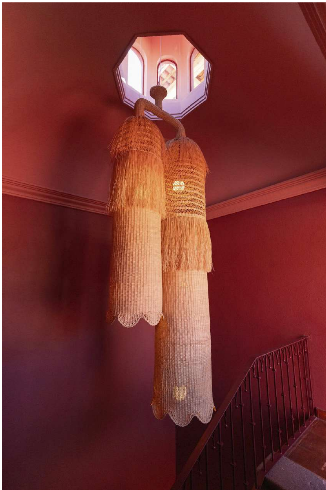
Interieurstudio Mestiz, die net als Casa Coa z'n thuisbasis heeft in San Miguel de Allende, liet zich voor de gigantische hanglamp in het trappengat inspireren door de Brugmansia in de tuin van het huis

Linkerpagina Bank, salontafel en sidetable van Azotea, fauteuils van Manush, vazen en hanglamp van Mestiz, kunstwerk door Manolo Cocho, gordijnen van Telas de Pani